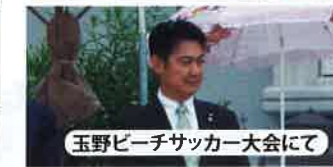
玉野ビーチサッカー大会にて