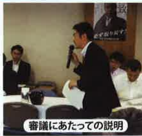
審議にあたっての説明

■中小企業政策調査会会長補佐として取りまとめた「ものづくり・商業・サービス革新補助金」などの施策が結実！