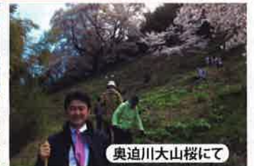
奥迫川大山桜にて