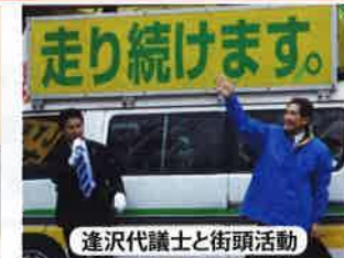
逢沢代議士と街頭活動