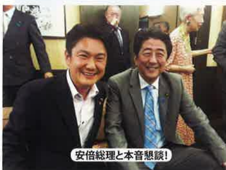
安倍総理と本音懇談!