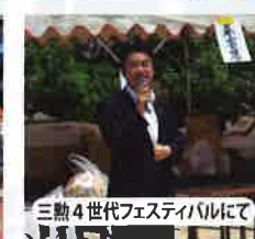
三助4世代フェスティバルにて