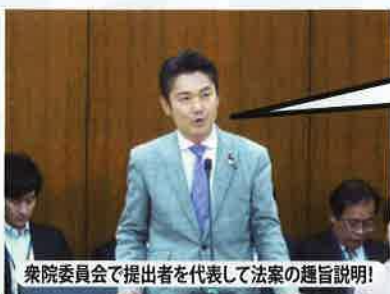
衆院委員会で提出者を代表して法案の趣旨説明!

国民が安心して心理的な支援を利用できるようにするため、国家資格によって裏づけられた一定の資質を備えた専門職が必要!