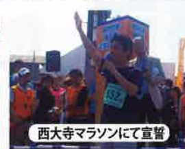
西大寺マラソンにて宣誓