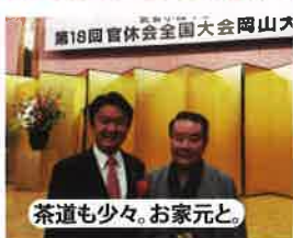
茶道も少々。お家元と。