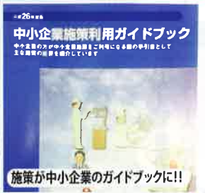
施策が中小企業のガイドブックに！！

■司法制度調査会事務局長としての活躍が、世代交代・政策転換を主導する「ニュー法務族」としてメディアに！