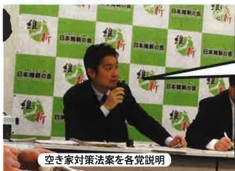
空き家対策法案を各党説明