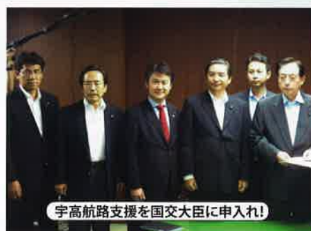
宇高航路支援を国交大臣に申入れ!