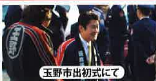
玉野市出初式にて