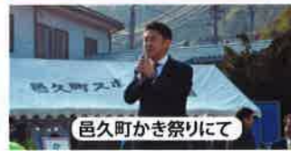
邑久町かき祭りにて