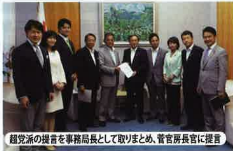
超党派の提言を事務局長として取りまとめ、菅官房長官に提言

与党の部会・調査会や超党派議連の事務局長などとして取りまとめた政策が、「日本再興戦略」、「骨太の方針」、「科学技術イノベーション総合戦略」、「知的財産推進計画」などで続々採用されました！ その一例をあげると。。。