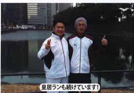
皇居ランも続けています!