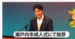
瀬戸内市成人式にて挨拶