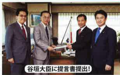
谷垣大臣に提言書提出！

■司法制度調査会事務局長としての活躍が、世代交代・政策転換を主導する「ニュー法務族」としてメディアに！