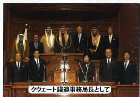
クウェート議連事務局長として