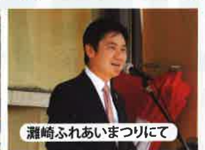
瀬崎ふれあいまつりにて