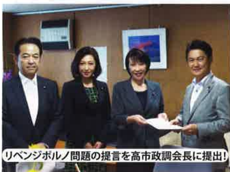
リベンジボルノ問題の提言を高市政調会長に提出!