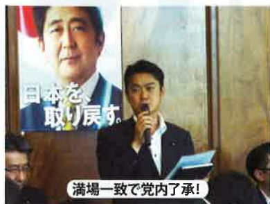
満場一致で党内了承!

昨年の「研究開発力強化法改正法」「原発損害賠償時効延長法」に続き、「公認心理師法案」「国外犯罪被害者遺族弔慰金支給法案」の2法案を提出しました!「公認心理師法案」は、国民が安心して心理的な支援を利用するため、「心の問題」に取り組む心理専門職の方々の国家資格を新設する法案、「国外犯罪被害者遺族弔慰金支給法案」は日本人が海外で犯罪に遭って死亡した場合、ご遺族に最高100万円の弔慰金を支給する法案で、いずれも秋に予定される臨時国会での成立を目指しています。