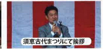
須恵古代まつりにて挨拶