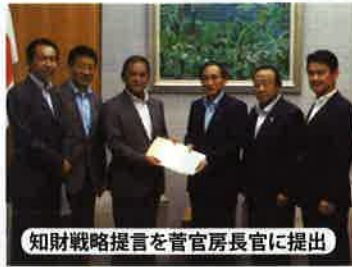
知財戦略提言を菅官房長官に提出

■知的財産戦略調査会事務局次長として地域ブランドの推進などを提言！「おかやま和牛肉」も商標登録に！