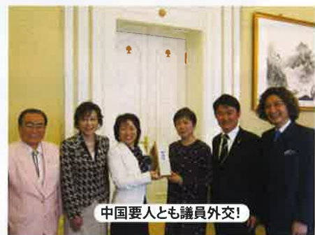
中国要人とも議員外交!