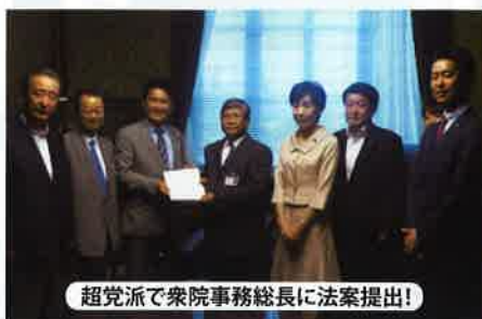
超党派で衆院事務総長に法案提出!