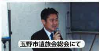
玉野市遺族会総会にて