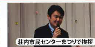
荘内市民センターまつりで挨拶