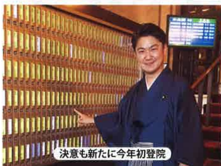
決意も新たに今年初登院