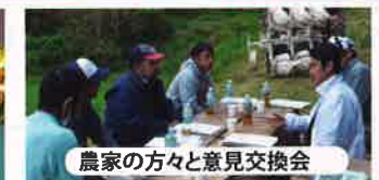
農家の方々意見交換会