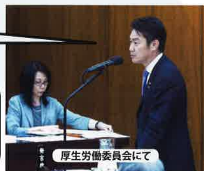
厚生労働委員会にて