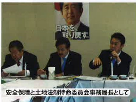
安全保障と土地法制特命委員会事務局長として