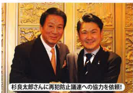
杉良太郎さんに再犯防止議連への協力を依頼!