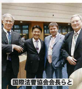
国際法曹協会会長らと