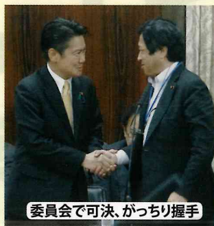
委員会で可決、がっちり握手