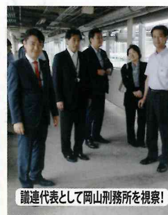
議連代表として岡山刑務所を視察!