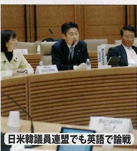
日米韓議員連盟でも英語で論戦