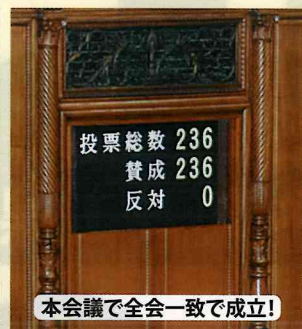
本会議で全会一致で成立!