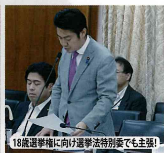
18歳選挙権に向け選挙法特別委でも主張!