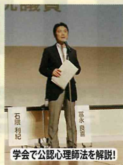
学会で公認心理師法を解説!