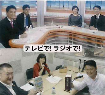
テレビで! ラジオで!