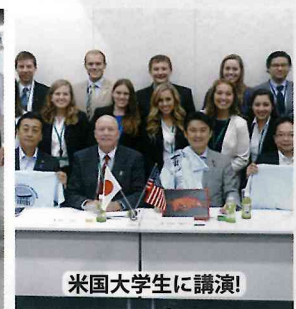
米国大学生に講演!