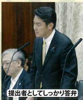
提出者としてしっかり答弁