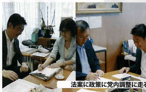
法案に政策に党内調整に走る!!