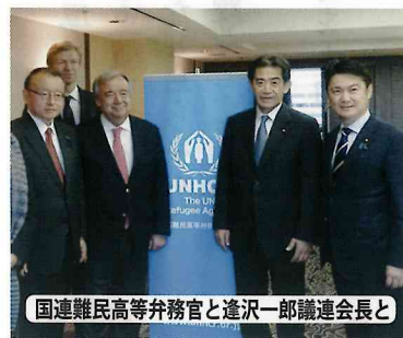
国連難民高等弁務官と逢沢一郎議連会長と