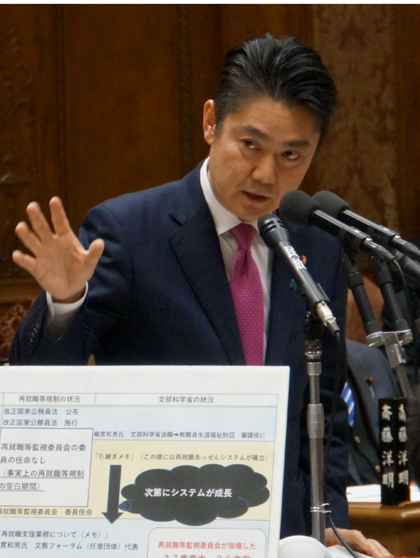
衆議院議員 山下 貴司

国会議員となつて5年目の通常国会を終えることができました。お陰様で党内外から若手論客の代表として評価をいただき、衆院予算委などで質問の機会をいただく一方で、メディアにも多く出演させていただきました。また、政策においても「所有者不明土地対策」「介護」などの重要施策について事務局長などとして取りまとめた成果が政府の方針となっています。 長期政権からの驕り・緩みとのご指摘に謙虚に耳を傾け、初心を忘れず、明日の日本とふるさと岡山のために日本が直面する諸課題に「突破力」で取り組む所存です。 今後ともご支援のほどよろしくお願いたします。