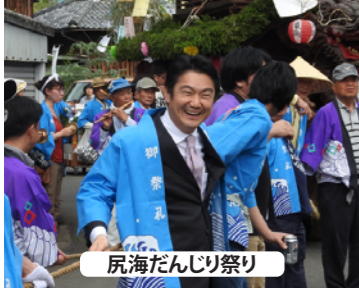
尻海だんじり祭り