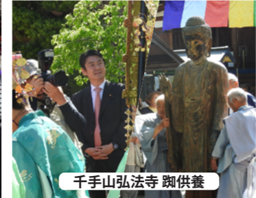
千手山弘法寺 脚供養