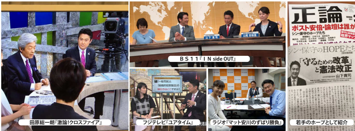
田原総一朗『激論!クロスファイア』