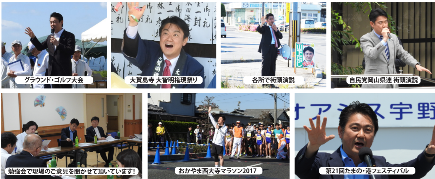
グラウンド・ゴルフ大会