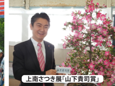
上南さつき展「山下貴司賞」