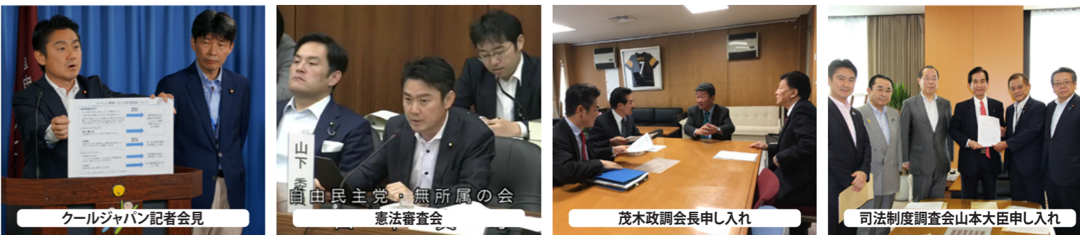
クールジャパン記者会見