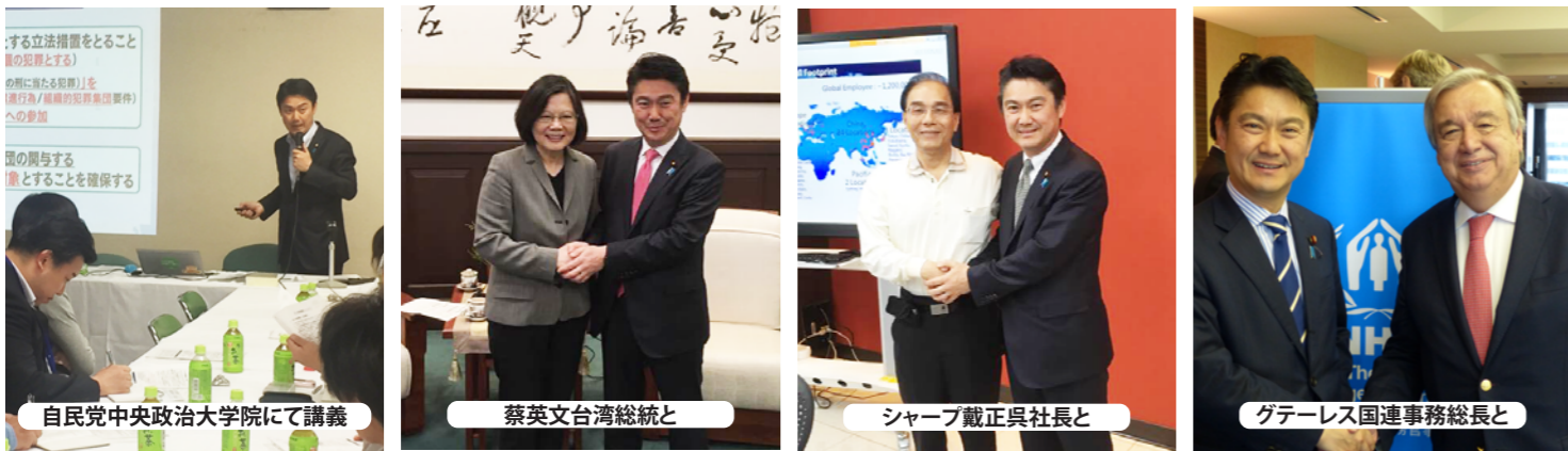
自民党中央政治大学院にて講義