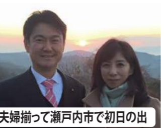
夫婦揃って瀬戸内市で初日の出