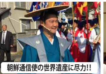
朝鮮通信使の世界遺産に尽力!!