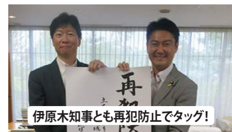
伊原木知事も再犯防止でタッグ!