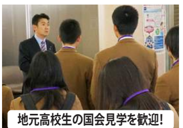
地元高校生の国会見学を歓迎!