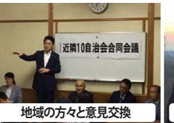
地域の方々と意見交換