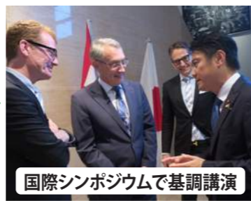
国際シンポジウムで基調講演