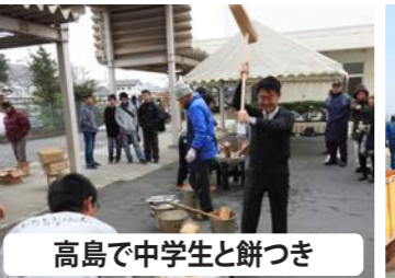
高島で中学生と餅つき