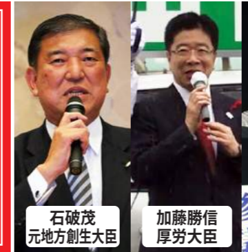
石破茂 元地方創生大臣