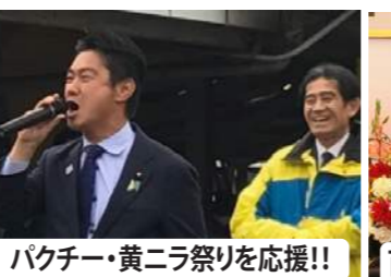
バクチー・黄ニラ祭りを応援!!