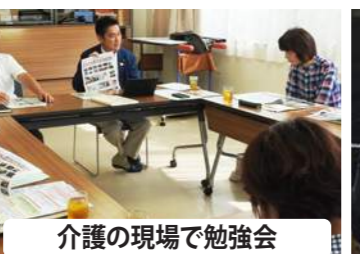
介護の現場で勉強会