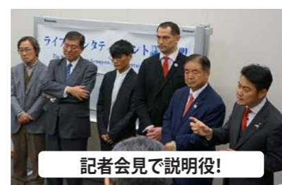
記者会見で説明役!

多くのファンがコンサート等のチケットを手にするよう、議員立法も視野にしっかり対応