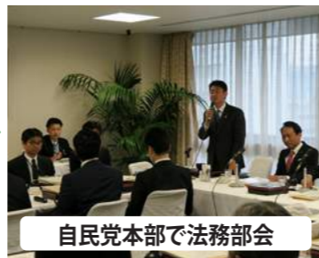
自民党本部で法務部会