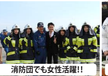
消防団でも女性活躍!!