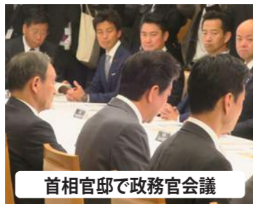
首相官邸で政務官会議