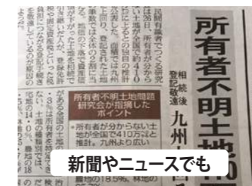
新聞やニュースでも

所有者不明土地の緊急対策を特命委員会事務局長として取りまとめ、政府でも法務政務官としてリード!!