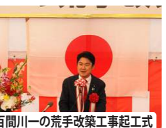
百間川一の荒手改築工事起工式