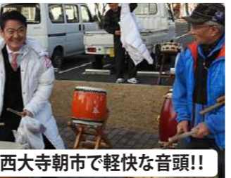
西大寺朝市で軽快な音頭!!