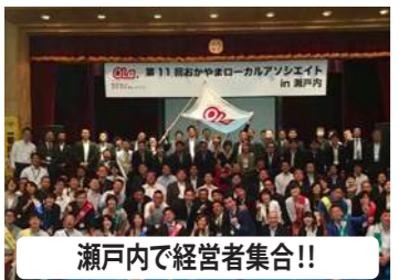
瀬戸内で経営者集合!!