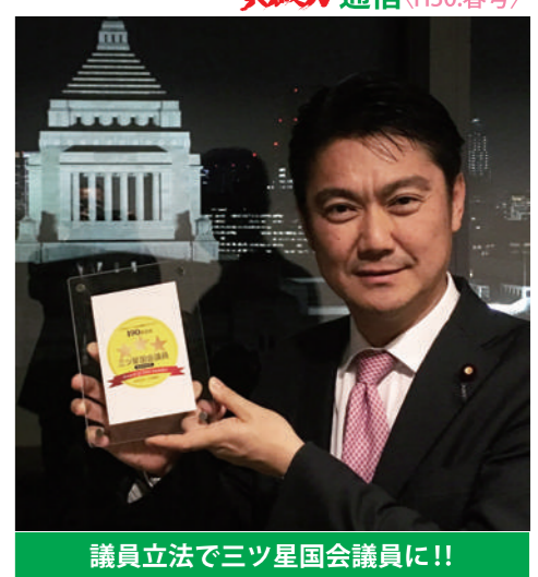
議員立法で三ツ星国会議員に!!