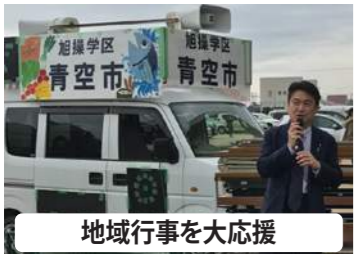
地域行事を大応援