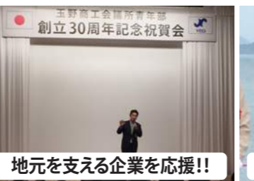
地元を支える企業を応援!!