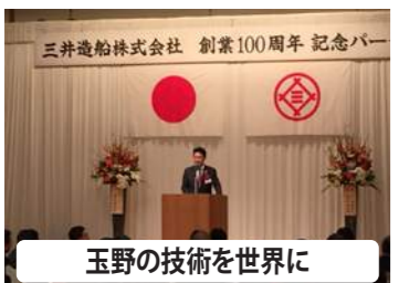
玉野の技術を世界に