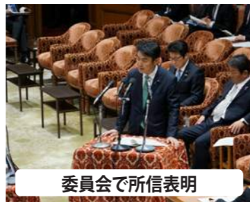
委員会で所信表明