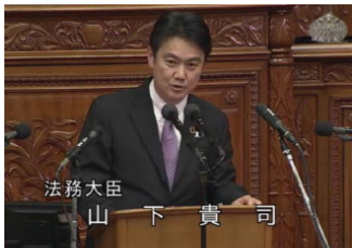
法務大臣 山下 貴司