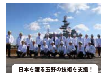
日本を守る玉野の技術を支援!