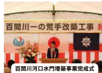
百間川一ノ荒手改築工事 起 百間川河口水門増築事業完成式