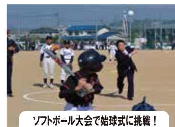
ソフトボール大会で拾球式に挑戦!