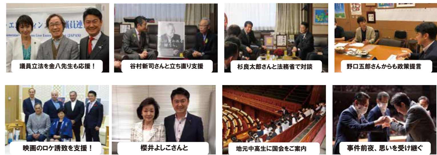
議員立法を金八先生も応援！ 谷村新司さんと立ち直り支援 杉良太郎さんと法務省で対談 野口五郎さんからも政策提言 映画のロケ誘致を支援！ 櫻井よしこさんと 地元中高生に国会をご案内 事件前夜、思いを受け継ぐ