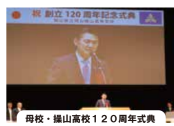
母校・操山高校120周年式典