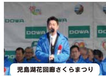
児島湖花回廊さくらまつり