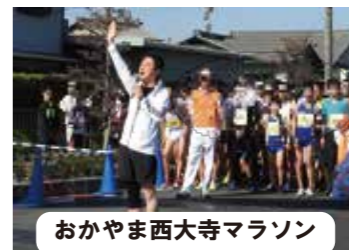
おかやま西大寺マラソン