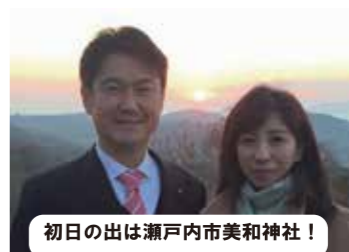
初日の出は瀬戸内市美和神社!