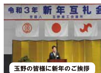
令和3年新年互礼会 玉野の皆様へ新年のご挨拶