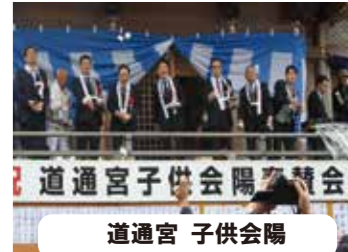
道通宮 子供会陽 道通宮 子供会陽