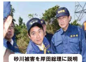
砂川被害を岸田総理に説明