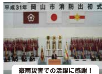
平成31年岡山市消防出初式 豪雨災害での活躍に感謝!