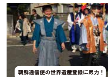
朝鮮通信使の世界遺産登録に尽力!