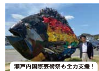
瀬戸内国際芸術祭も全力支援!