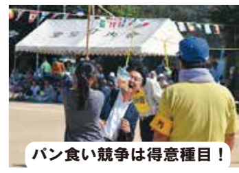
パン食い競争は得意種目!