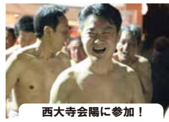
西大寺会陽に参加!