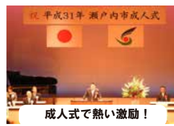
成人式で熱い激励!