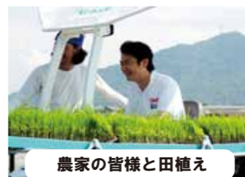
農家の皆様と田植え