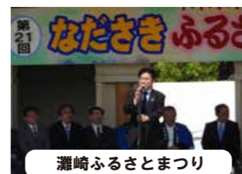
瀬崎ふるさとまつり