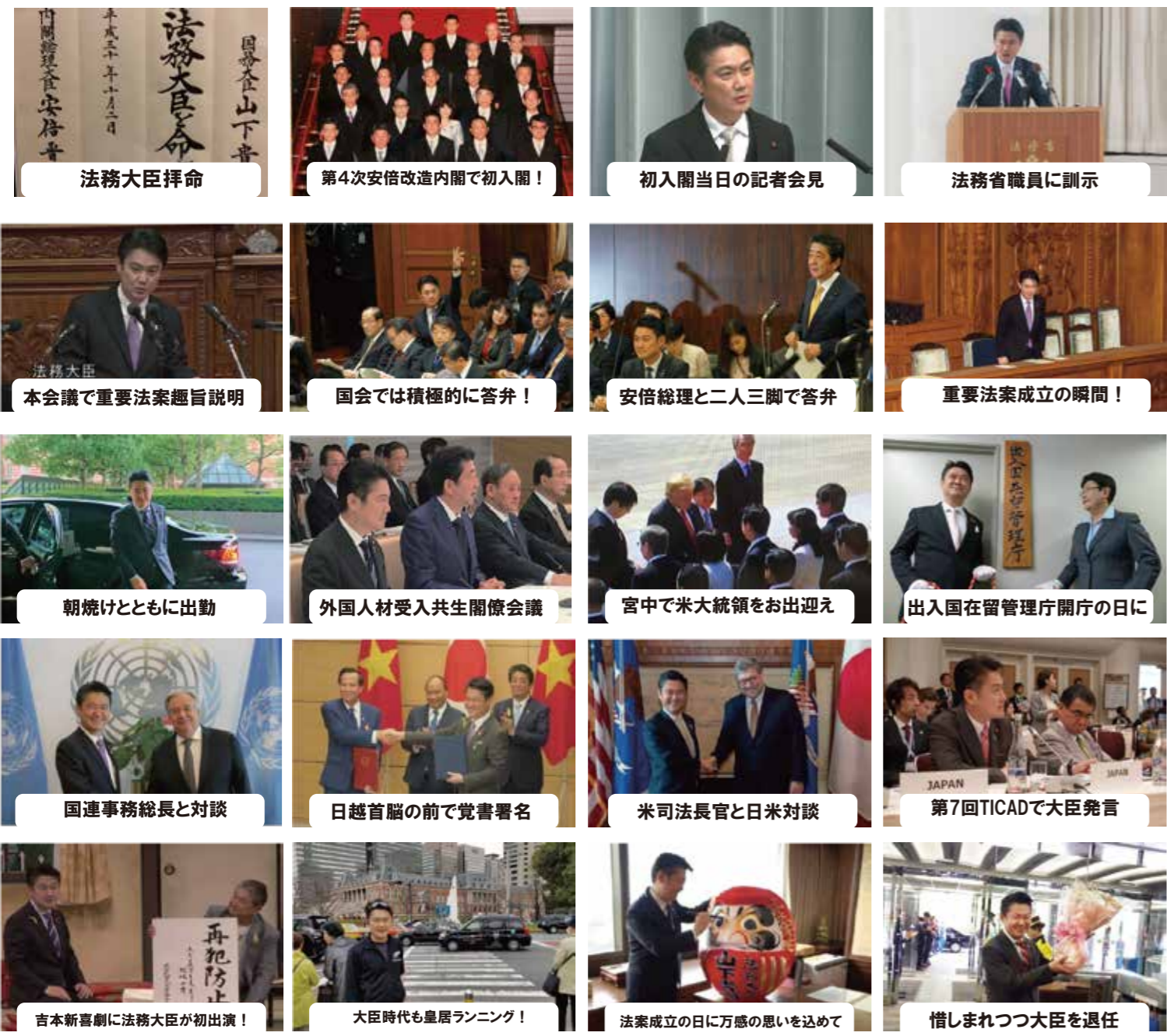
法務大臣拝命 第4次安倍改造内閣で初入閣！ 初入閣当日の記者会見 法務省職員に訓示 候補者時代は毎日街頭演説 皆様のお陰で初当選！ 1期目から議員立法案を提出 1期目から立案者として答弁 本会議で重要法案趣旨説明 国会では積極的に答弁！ 安倍総理と二人三脚で答弁 重要法案成立の瞬間！ 議員立法で三ツ星国会議員に！ 法案作成者として委員会答弁！ 憲法審査会で憲法学を踏まえて発言 予算委員会で熱い質疑 朝焼けとともに出勤 外国人材受入共生関係会議 宮中で米大統領をお出迎え 出入国在留管理庁開庁の日に 総理官邸での記者会見 ネットの誹謗中傷対策に全力！ 党改革を岸田総理に提言！ 党改革の議論をリード！ 国連事務総長と対談 日越首脳の前で党書署名 米司法長官と日米対談 第7回TICADで大臣発言 李登輝元台湾総統と会談 ダライ・ラマ法王と固い握手 米シンクタンクで英語で討論 米シンクタンクで英語で講演 吉本新喜劇に法務大臣が初出演！ 大臣時代も皇居ランニング！ 法案成立の日に万感の思いを込めて 惜しまれつつ大臣を退任