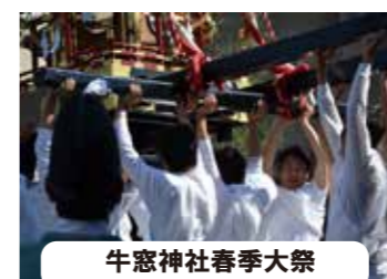
牛窓神社春季大祭