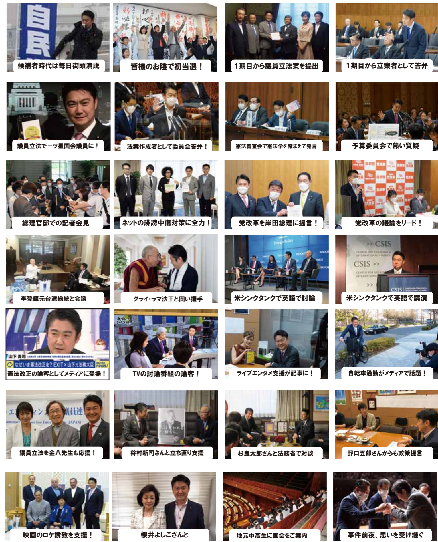
候補者時代は毎日街頭演説 皆様のお陰で初当選！ 1期目から議員立法案を提出 1期目から立案者として答弁 本会議で重要法案趣旨説明 国会では積極的に答弁！ 安倍総理と二人三脚で答弁 重要法案成立の瞬間！ 議員立法で三ツ星国会議員に！ 法案作成者として委員会答弁！ 憲法審査会で憲法学を踏まえて発言 予算委員会で熱い質疑 朝焼けとともに出勤 外国人材受入共生関係会議 宮中で米大統領をお出迎え 出入国在留管理庁開庁の日に 総理官邸での記者会見 ネットの誹謗中傷対策に全力！ 党改革を岸田総理に提言！ 党改革の議論をリード！ 国連事務総長と対談 日越首脳の前で党書署名 米司法長官と日米対談 第7回TICADで大臣発言 李登輝元台湾総統と会談 ダライ・ラマ法王と固い握手 米シンクタンクで英語で討論 米シンクタンクで英語で講演 吉本新喜劇に法務大臣が初出演！ 大臣時代も皇居ランニング！ 法案成立の日に万感の思いを込めて 惜しまれつつ大臣を退任