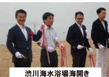
渋川海水浴場海開き