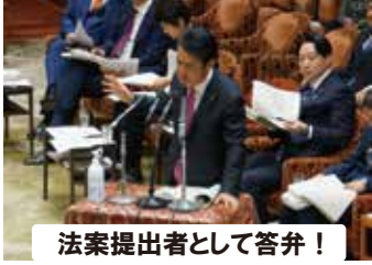
法案提出者として答弁！