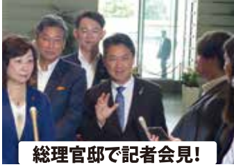
総理官邸で記者会見！