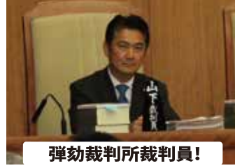
弾劾裁判所裁判員！