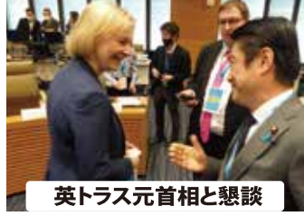
英トラス元首相と懇談