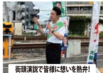
街頭演説で皆様に想いを熱弁！