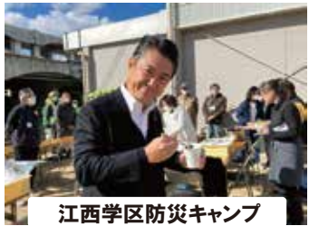
江西学区防災キャンプ