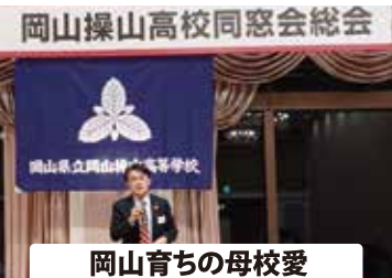
岡山育ちの母校愛