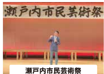
瀬戸内市民芸術祭