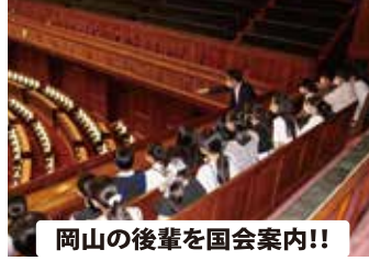
岡山の後輩を国会案内！！