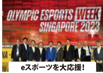
eスポーツを大応援！