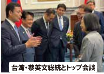
台湾・蔡英文総統とトップ会談