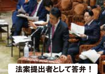
法案提出者として答弁！