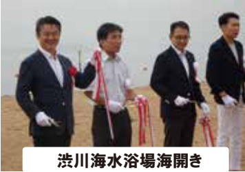
渋川海水浴場海開き