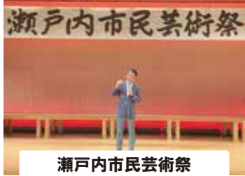
瀬戸内市民芸術祭