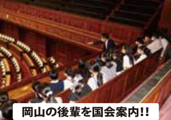
岡山の後輩を国会案内！！