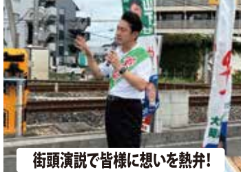
街頭演説で皆様に想いを熱弁！