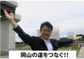
岡山の道をつなぐ！！