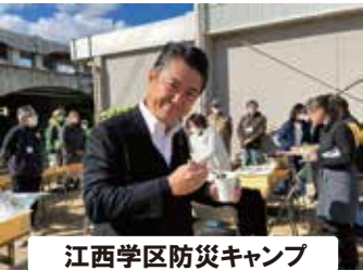
江西学区防災キャンプ