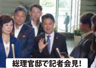
総理官邸で記者会見！