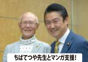
ちばてつや先生とマンガ支援！