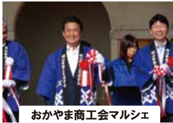
おかやま商工会マルシェ