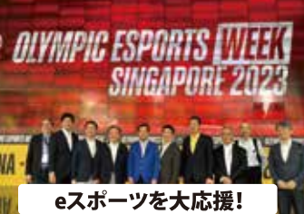
eスポーツを大応援！