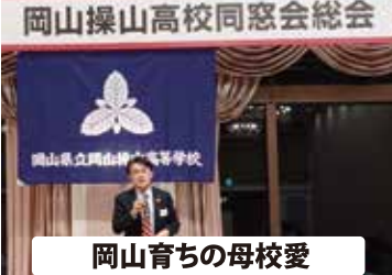
岡山育ちの母校愛