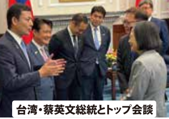
台湾・蔡英文総統とトップ会談