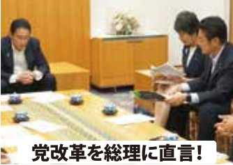
党改革を総理に直言！