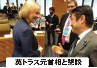
英トラス元首相と懇談