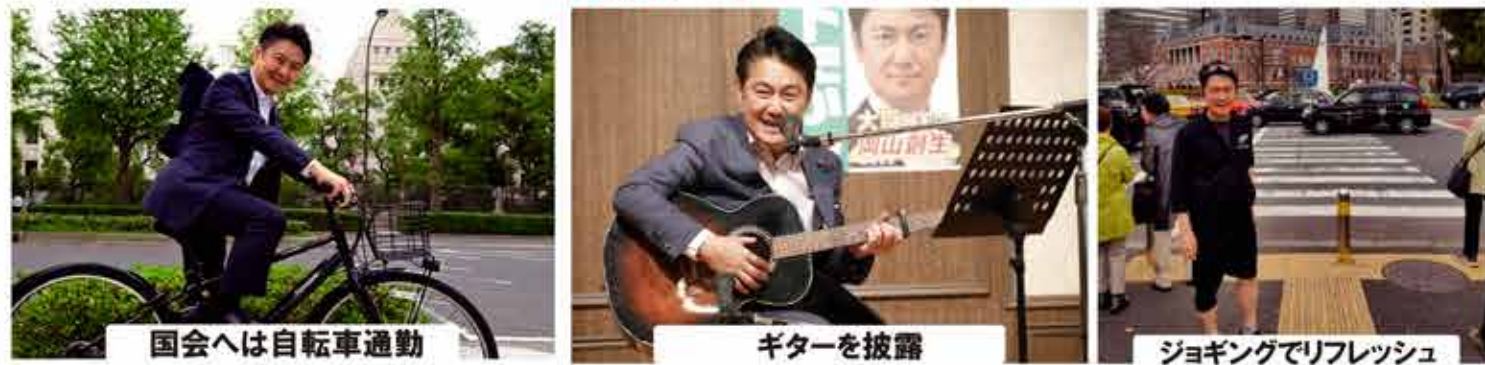
国会へは自転車通勤