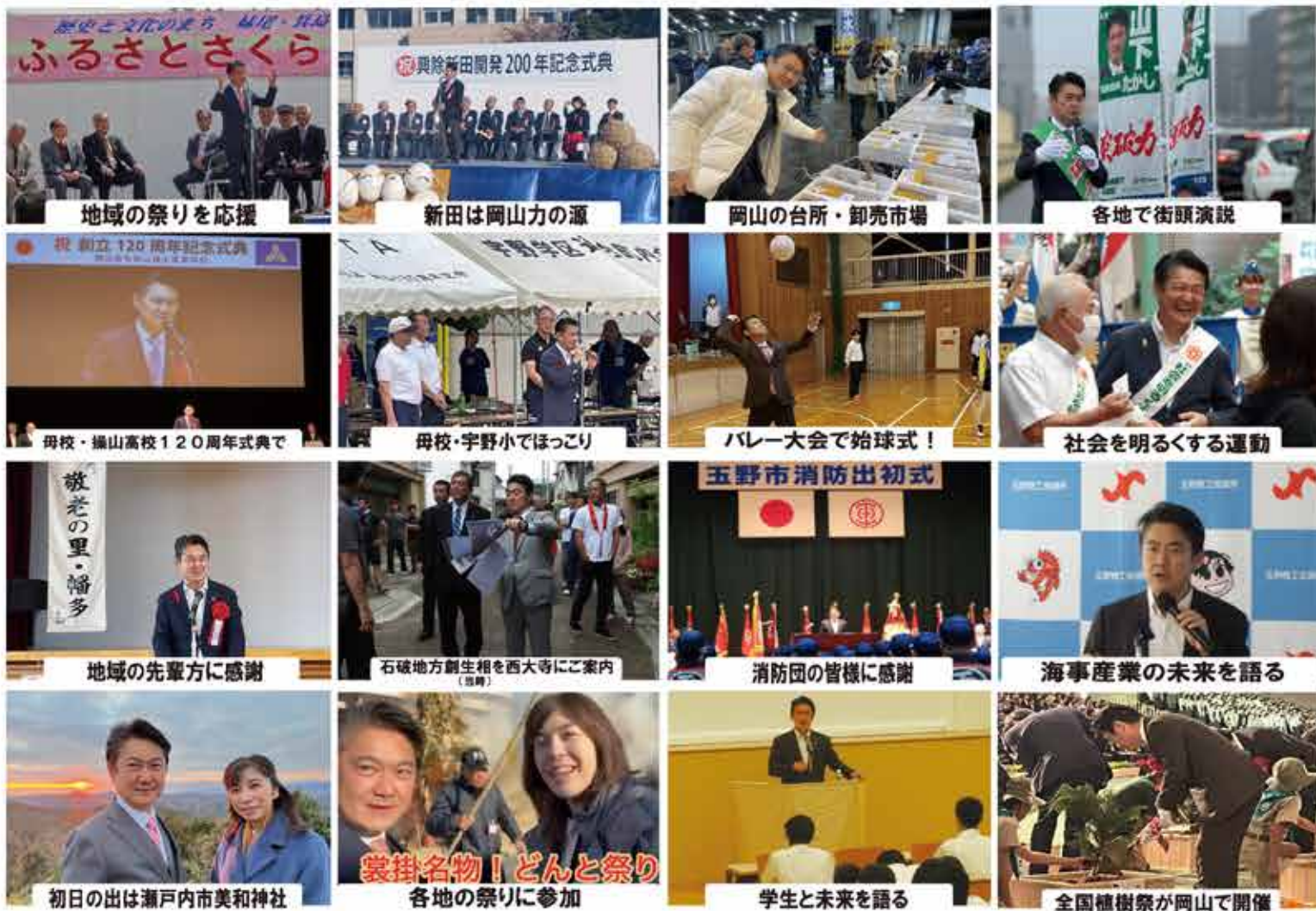
地域の祭りを応援