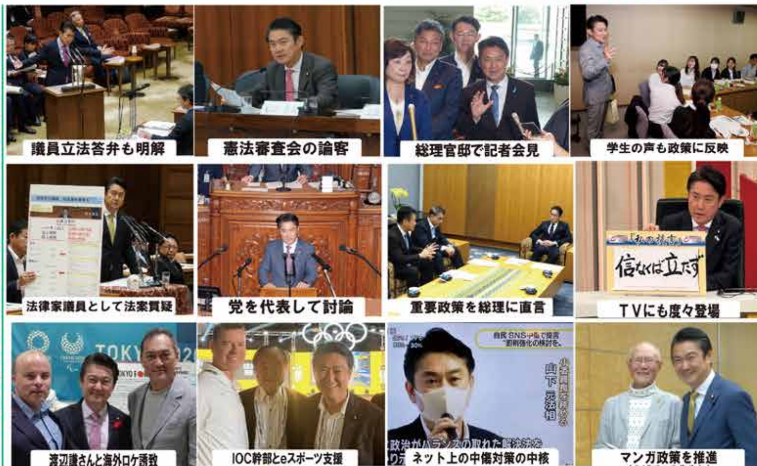
議員立法答弁も明解