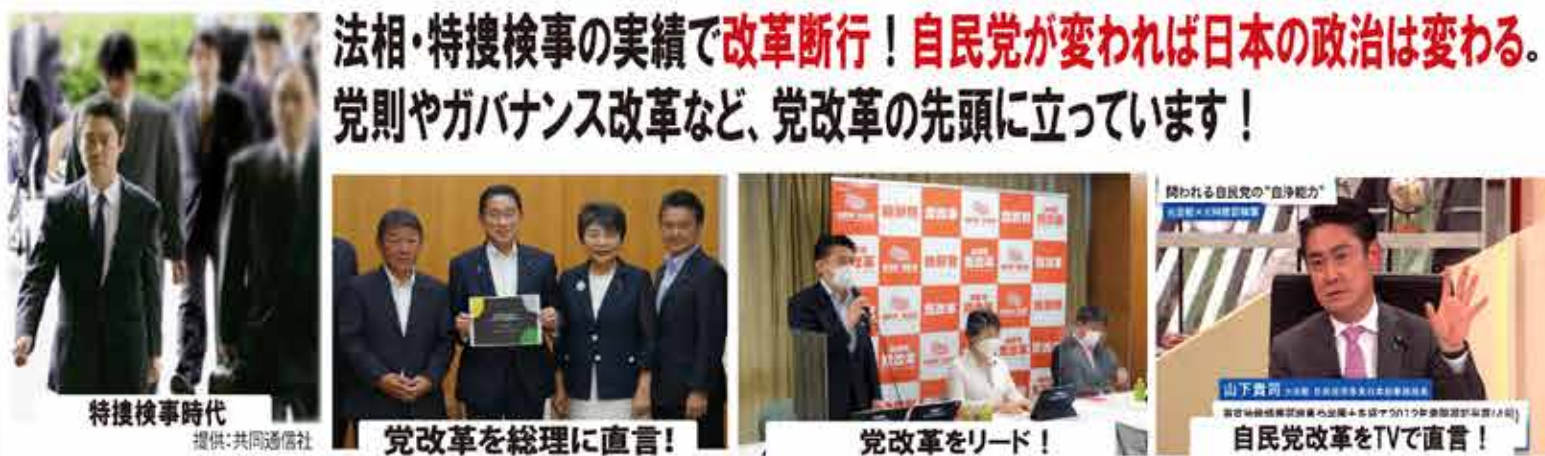
特捜検事時代

法相・特捜検事の実績で改革断行！自民党が変われば日本の政治は変わる。党則やガバナンス改革など、党改革の先頭に立っています！